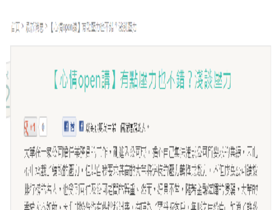
【心情 open 講】有點壓力也不錯? 淺談壓力