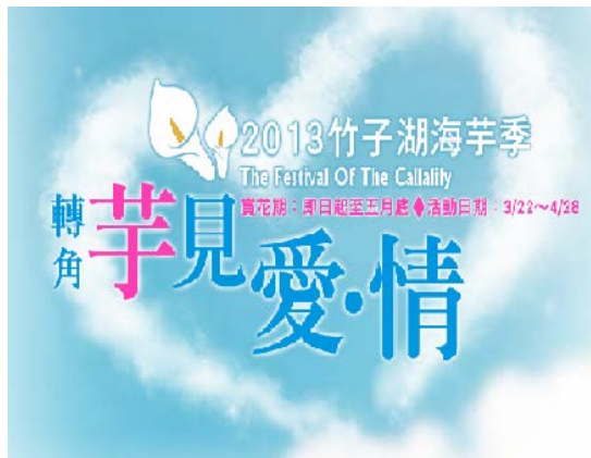
2013 竹子湖海芋季 轉角芋見愛情