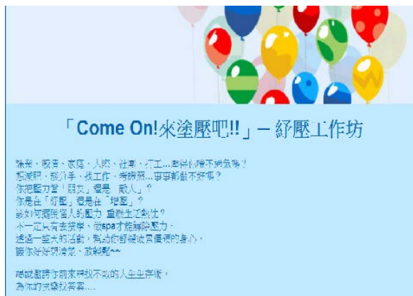
【壓力知多少】「Come On! 來塗壓吧!!」— 紓壓工作坊，讓我們一起塗掉壓力吧！