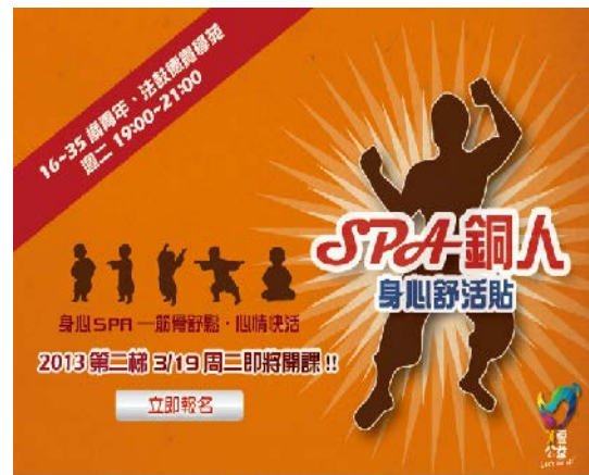
SPA 銅人，身心舒活貼 身心 SPA，筋骨疏鬆，心情快活